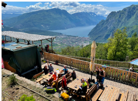
Mittagspause mit Blick zum Gardasee