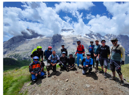
Hochalpine Traumkulisse jeden Tag