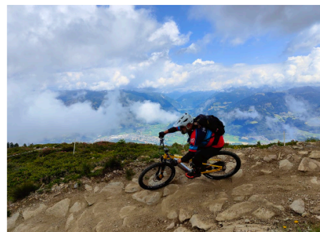
Auftakt am Kronplatz

Fast nur abwärts! Die Transalp Enduro nutzt täglich mehrfach die Seilbahn für den optimalen Enduro-Fahrspaß meist auf gebauten Bikepark-Trails. Die Höhenmeter halten sich in Grenzen, um genügend Kraft und Energie für die Downhill-Strecken zu haben. Spektakuläre Dolomiten Gipfel sind zum Greifen nah! Kronplatz, Marmolata, Sella, Pordoi oder Langkofel. Jeden Tag sind wir in einer imposanten Naturkulisse über 2200 Meter hoch. Ein Trailfeuerwerk auf Level 3-4 mit über 100 km Trails.