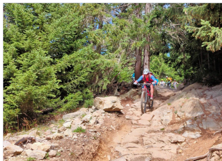
Fahrtechnisch anspruchsvoll im Bunkertrail