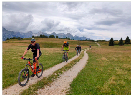
Am Monte Gazza